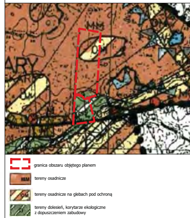
Wyrus ze Studium uwarunkowań i kierunków zagospodarowania przestrzennego gminy Gniezno skala 1:10000

Cały obszar objęty planem położony jest w granicach Głównego Zbiornika Wód Podziemnych nr 143 Subzbiornik Inowrocław-Gniezno.