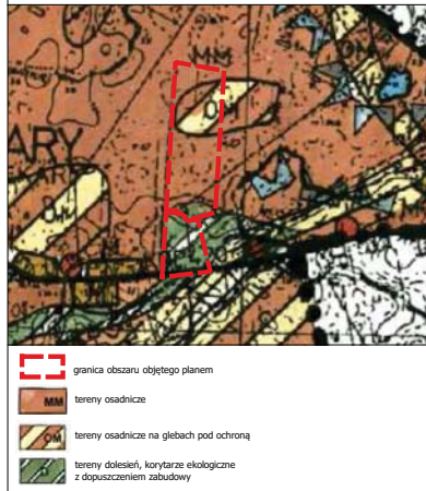
Wyrys ze Studium uwarunkowań i kierunków zagospodarowania przestrzennego gminy Gniezno skala 1:10000

Cały obszar objęty planem położony jest w granicach Głównego Zbiornika Wód Podziemnych nr 143 Subzbiornik Inowrocław-Gniezno.