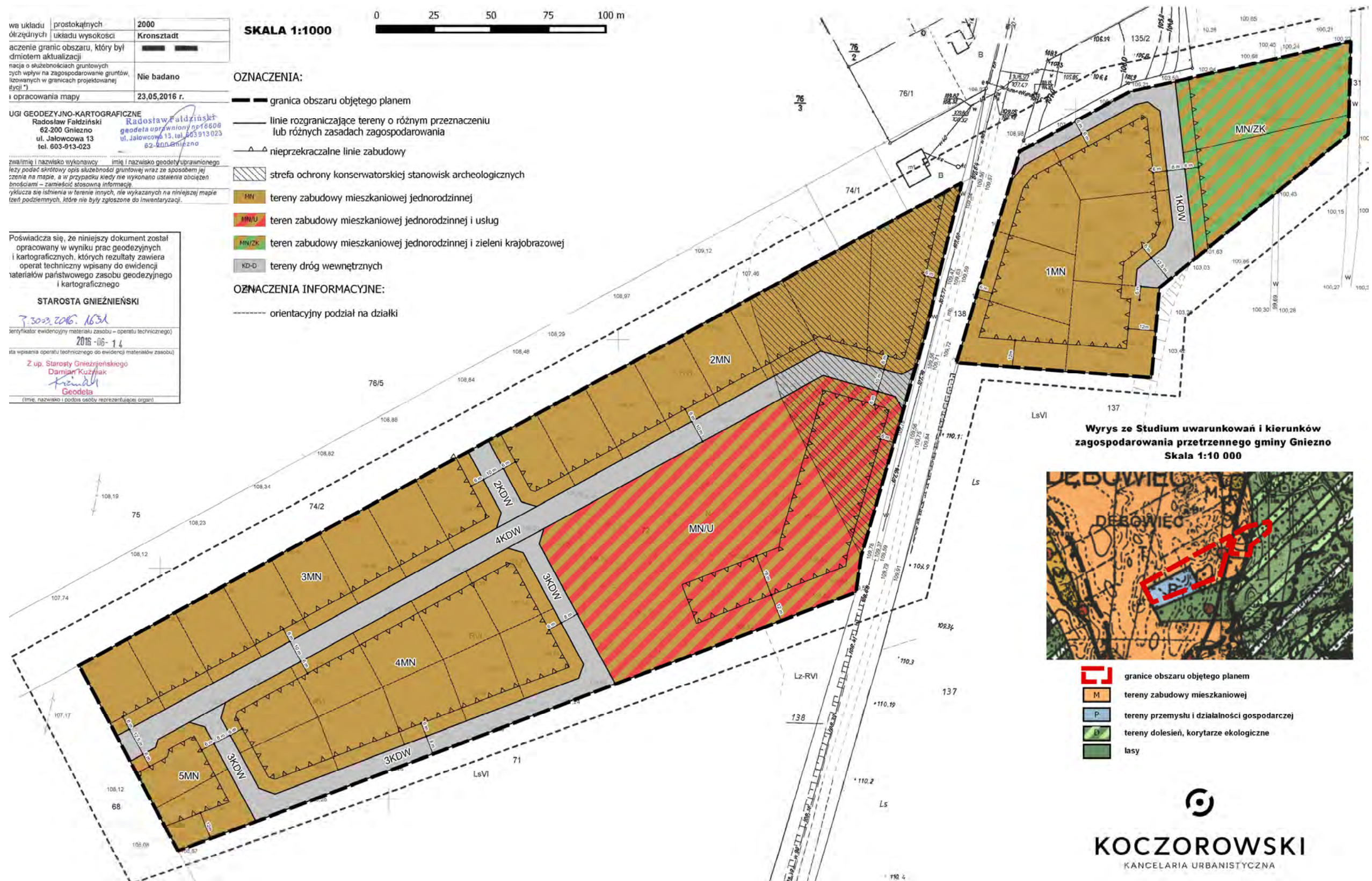
Wyrys ze Studium uwarunkowań i kierunków zagospodarowania przestrzennego gminy Gniezno Skala 1:10 000