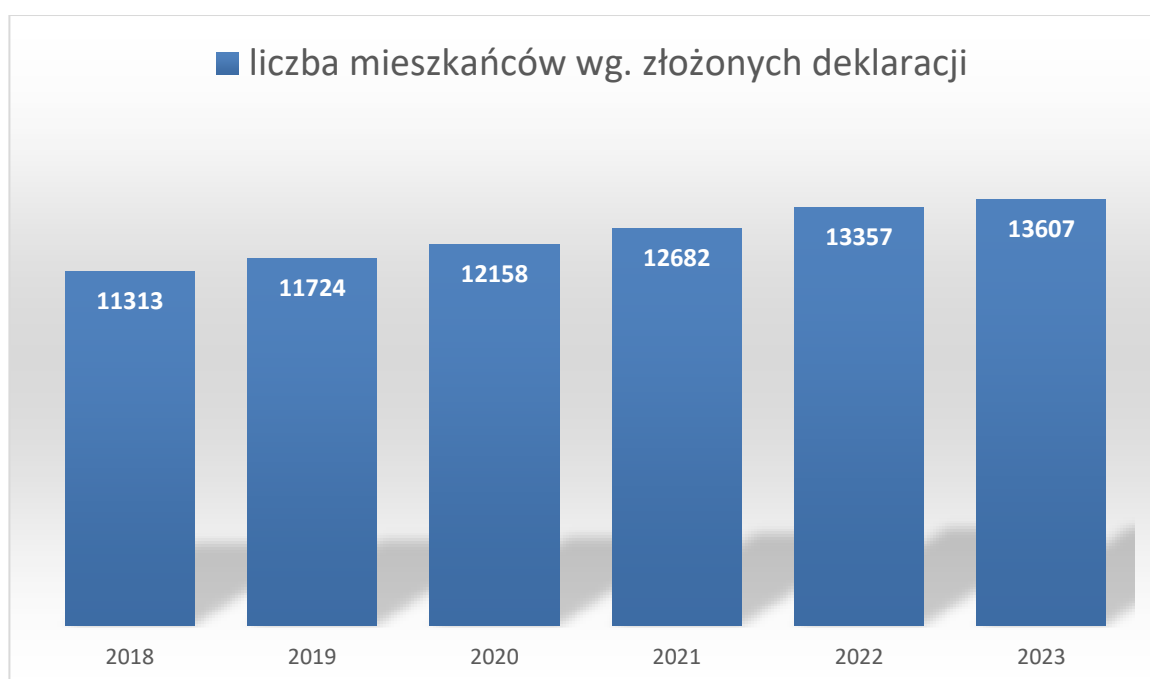
Wykres 1. Liczba mieszkańców gminy Gniezno wg. złożonych deklaracji w latach 2018-2023

Liczba mieszkańców Gminy Gniezno na podstawie złożonych przez właścicieli nieruchomości deklaracji o wysokości opłaty za gospodarowanie odpadami komunalnymi z roku na roku przyjmuje tendencję wzrostową, co stanowi jeden z determinantów wzrostu kosztów funkcjonowania systemu gospodarki odpadami komunalnymi.