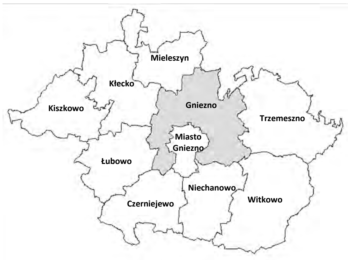
Ryc. 1. Gmina Gniezno na tle powiatu gnieźnieńskiego

Gmina Gniezno jest jedną z dziesięciu gmin powiatu gnieźnieńskiego, leżącego w północno-wschodniej części województwa wielkopolskiego. Jest drugą co do wielkości powierzchni gminą powiatu – zajmuje obszar 177,99 km 2 . Graniczy bezpośrednio ze wszystkimi gminami powiatu za wyjątkiem Gminy Kiszkowo. Od północy sąsiaduje z leżącą w powiecie żnińskim i województwie kujawsko-pomorskim Gminą Rogowo. W charakterystyczny sposób graniczy z gminą miejską Miasto Gniezno otaczając ją otwartym pierścieniem od północy, wschodu i zachodu. Gmina podzielona jest na 31 sołectw tworzących aparat pomocniczy jej administracji (ryc. 1).